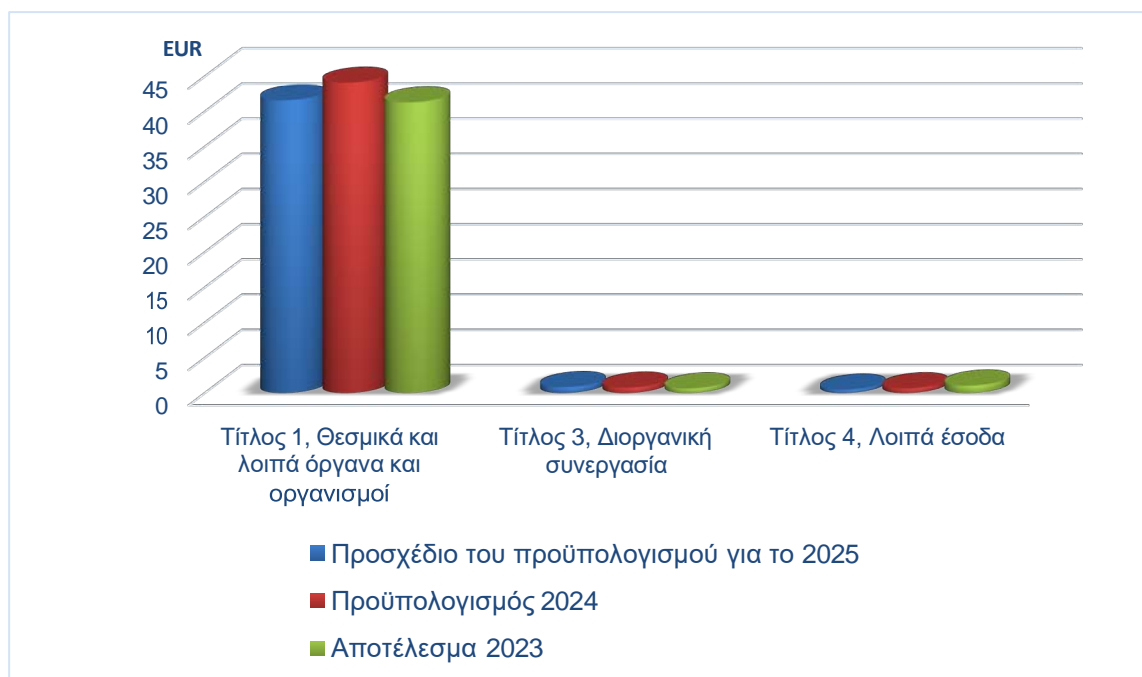
Διάγραμμα 1. Έσοδα κατανομημένα κατά τίτλο και έτος: 2023-2025 (Τίτλοι 1, 3 και 4)

Εκτός από τα έσοδα που προέρχονται από τους πελάτες και τη διοργανική συνεργασία, το Κέντρο προβλέπει την είσπραξη επιπλέον εσόδων στον τίτλο 4, στα οποία περιλαμβάνονται κυρίως οι τραπεζικοί τόκοι, τα έσοδα από τη φιλοξενία κέντρου δεδομένων για τον ERA («Οργανισμός Σιδηροδρόμων της Ευρωπαϊκής Ένωσης») και η επιδότηση από την κυβέρνηση του Λουξεμβούργου για τη μίσθωση του κτιρίου Η πρόβλεψη για τα εν λόγω έσοδα το 2025 είναι 516 200 EUR, ποσό χαμηλότερο κατά 27,1 % από αυτό του προϋπολογισμού του 2024 και χαμηλότερο κατά 53,2 % σε σχέση με το αποτέλεσμα του 2023.