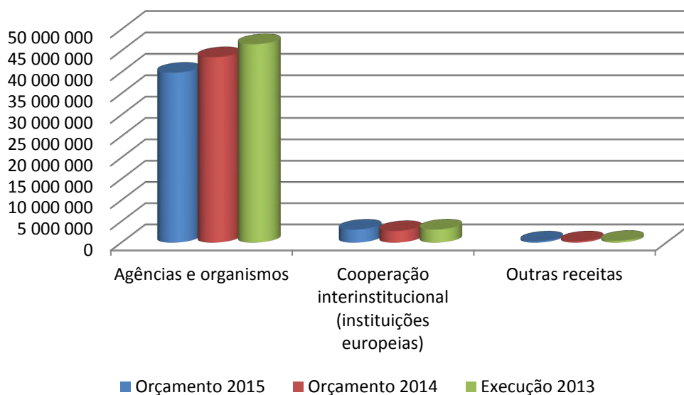
Quadro 1 - Receita (EUR) por título e exercício financeiro, 2013-2015 (Títulos 1, 3 e 4)

O Centro recorreu à possibilidade de transferir para as receitas recursos provenientes de duas reservas constituídas em exercícios anteriores. O orçamento inclui nas receitas 809 000 euros provenientes da «Reserva para investimentos excecionais». Este montante corresponde às despesas previstas para o programa e-CdT em 2015, inscritas no Capítulo 32. Adicionalmente, o Centro transferiu para as receitas uma parte da «Reserva para a estabilidade dos preços» constituída em 2011 (4 850 350 euros). Esta transferência equilibra o orçamento e permite ao Centro propor aos seus clientes preços mais baixos, bem como reduzir o excedente orçamental.