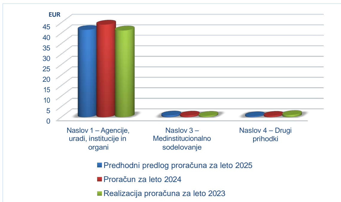
Diagram 1: Razčlenitev prihodkov po naslovih in letih: 2023–2025 (naslovi 1, 3 in 4)

Prevajalski center poleg prihodkov od strank in medinstitucionalnega sodelovanja predvideva dodatne prihodke v naslovu 4, ki zajemajo predvsem bančne obresti , prihodek od gostovanja podatkovnega centra za Agencijo Evropske unije za železnice (ERA) in nepovratna sredstva luksemburške vlade za stroške, ki jih ima z najemom stavbe. Napoved teh prihodkov v letu 2025 znaša 516 200 EUR, kar je za 27,1 % manj od proračuna za leto 2024 in 53,2 % manj od realizacije za leto 2023.