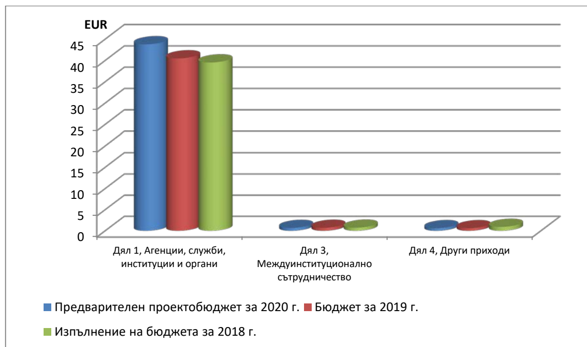
Фигура 1. Приходи в разбивка по дялове* и години: 2018—2020 г. (дялове 1, 3 и 4)

В допълнение към приходите от възложители и междуинституционално сътрудничество, Центърът прогнозира допълнителни приходи в дял 4, основно под формата на банкови лихви, приходи от преотдаване под наем на част от наетото офис пространство на Комисията (Изпълнителна агенция за потребителите, здравеопазването, селското стопанство и храните (Chafea)), приходи от хостинг на услуги, свързани с център за данни, които Центърът предоставя на ERA (Агенцията за железопътен транспорт на Европейския съюз), и финансова вноска от