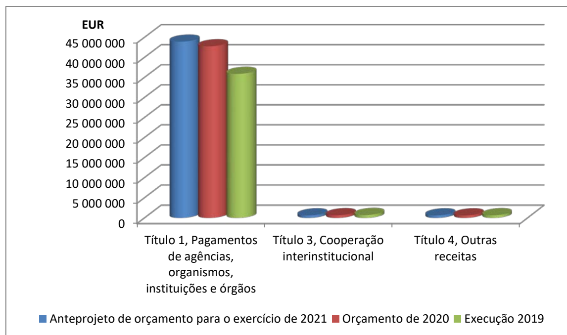
Figura 1. Receitas repartidas por título e exercício financeiro: 2019-2021 (títulos 1, 3 e 4)

As receitas do título 3 correspondem às receitas que o Centro recebe na qualidade de entidade responsável pela gestão da base de dados interativa de terminologia IATE («Inter-Active Terminology for Europe»). As despesas do Centro com a base de dados IATE são inscritas no capítulo 31 (Despesas).